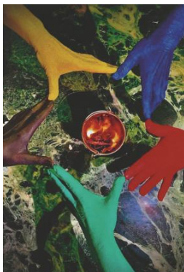
1. Platz Gruppe 4 (2021)