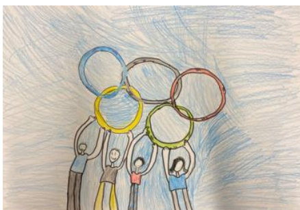
1. Platz Gruppe 1 (2021)

Für die Gruppen 1 bis 3 (Stufen 1 bis 6): Künstlerische Auseinandersetzung mit der Thematik Olympischer und Paralympischer Spiele unter besonderer Berücksichtigung der Leitthematik „Sport verbindet“. Die Bilder müssen das Format DIN A3 bzw. A4 haben. Passepartout oder Rahmen sind nicht zugelassen. Es müssen gemalte oder gezeichnete Bilder sein, also keine geklebten Bilder. Die Mal- bzw. Zeichentechnik sowie das Farbenspektrum sind freigestellt.