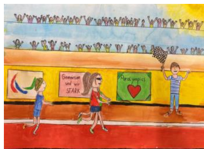
1. Platz Gruppe 2 (2021)