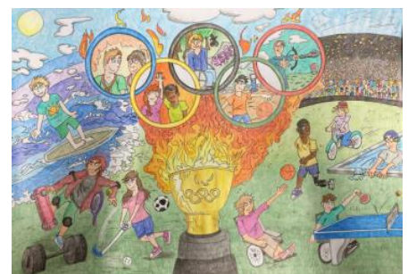
1. Platz Gruppe 3 (2021)

Für die Gruppe 4 (Stufen 7 bis 10): Fotografische Auseinandersetzung mit der Thematik Olympischer und Paralympischer Spiele unter besonderer Berücksichtigung der Leitthematik „Sport verbindet“. Die Papierbilder sind in der Größe 20 x 30 cm, Hochglanz und ohne Rahmen, einzureichen. Bild-Dateien sind erst auf Nachfrage durch den Ausrichter einzusenden. Das Farbenspektrum ist freigestellt.