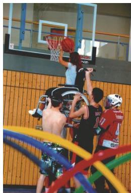
2. Platz Gruppe 4 (2021)